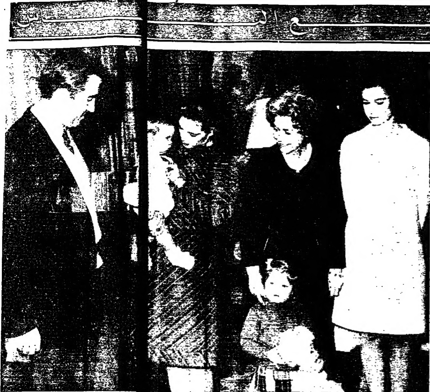
الملك قسطنطين والملكة اليونانية يواخون المصورين العاملين لأول مرة في فيلا بومبي